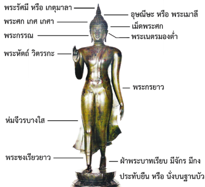
ภาพที่ ๓๔ แสดงภาพหลักธรรมที่ปรากฏในพระพุทธรูปสมัยสุโขทัย ๔๕

พระพุทธรูปถูกสร้างขึ้นภายใต้คติความเชื่อที่แทบจะเปลี่ยนรูปแบบเป็นอื่นไม่ได้ พุทธลักษณะขององค์พระพุทธรูป จึงมีความสัมพันธ์กับคติมหาบุรุษลักษณะ ซึ่งตามความเชื่อทางพุทธศาสนาถือว่า พระพุทธรูปมีลักษณะทางกายภาพที่ต่างไปจากมนุษย์ธรรมดาสามัญ กล่าวคือ มีลักษณะมหาบุรุษ ๓๒ ประการ และอนุพยัญชนะ ๘๐ ประการ (ดูภาพ ๓๔) การสร้างพระพุทธรูปสมัยสุโขทัยก็เช่นกัน มิได้คำนึงถึงความสวยงามที่เป็นเลิศเพียงอย่างเดียว แต่ได้