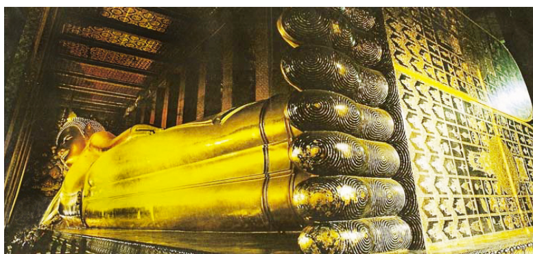
ภาพที่ ๓๖ แสดงภาพฝ่าพระบาท และรูปมงคล ๖๙

กลางฝ่าพระบาทเป็นรูปจักรแวดล้อมด้วยรูปมงคล ๑๐๘ ประการ (ดูภาพ ๓๖)