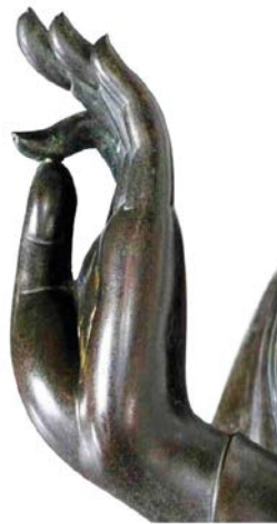
ภาพที่ ๓๕ แสดงภาพทรงแสดงธรรม (วितรรกะ) ๖๓

โดยใช้พระหัตถ์แสดงท่าทางต่าง ๆ เช่น ยกพระหัตถ์ขวาขึ้นระดับพระอุระ (ระดับอก) ทำมือจีบ พระอังศุกับพระคชณีเข้าด้วยกันเป็นสัญลักษณ์ของคาถาปริยาสัจ “เย ธมมาเหตุปปะวะ เตสัง เหตุ ตะถาคะโต เตสังจะ โย นิโรธะ จะ เอวัง วาที มหาสมโณ” ซึ่งถือว่าเป็นหัวใจของพุทธศาสนา ความว่า “ธรรมเหล่าใดเกิดแต่เหตุ พระตถาคต ตรัสเหตุแห่งธรรมเหล่านั้น และความดับแห่งธรรมเหล่านั้น พระมหาสมณะมีปกติตรัสอย่างนี้” ๖๑ (ดูภาพ ๓๕) หรือเรียกว่า พระพุทธรูปปางทรงแสดงธรรม (วितรรกะ) ๖๒