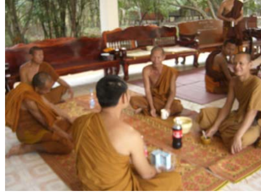
๗-๘) รูปภาพ ผู้ศึกษากับป้ายวัดไตรสิกขาและสัมภาษณ์คณะสงฆ์ตำบลแพด และผู้ร่วมปฏิบัติธรรมฯ (ภาพเมื่อวันที่ ๕ กุมภาพันธ์ ๒๕๕๕)