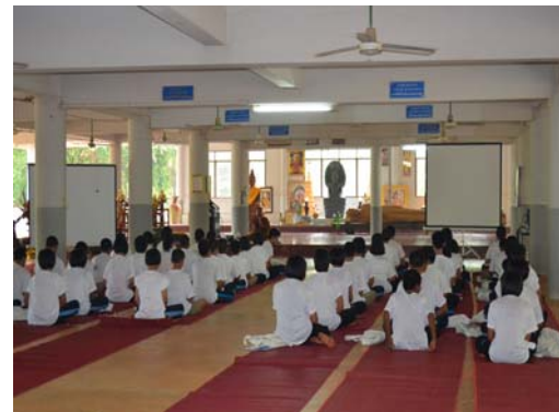
๙-๑๐) รูปภาพ สัมภาษณ์ผู้เข้าร่วมปฏิบัติธรรมวันนัดพบฯ และเยาวชนผู้เข้าร่วมปฏิบัติธรรม (ภาพเมื่อ วันที่ ๘ กุมภาพันธ์ ๒๕๕๕)