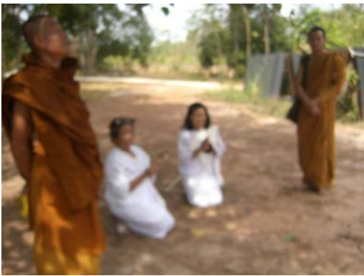
๙-๑๐) รูปภาพ สัมภาษณ์ผู้เข้าร่วมปฏิบัติธรรมวันนัดพบฯ (ภาพเมื่อ วันที่ ๘ กุมภาพันธ์ ๒๕๕๕)