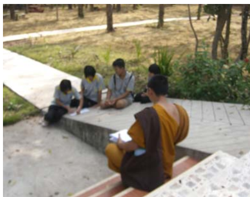
๕-๖) รูปภาพ สัมภาษณ์ผู้เข้าร่วมปฏิบัติธรรมวันนัดพบฯ (ภาพเมื่อวันที่ ๕ กุมภาพันธ์ ๒๕๕๕)