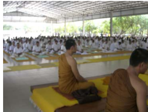
๑-๒) รูปภาพ เข้ากราบนมัสการพระอาจารย์สมภพ โชติปัญญา และ พระอุปัฏฐาก (ภาพเมื่อ วันที่ ๒ กุมภาพันธ์ ๒๕๕๕)