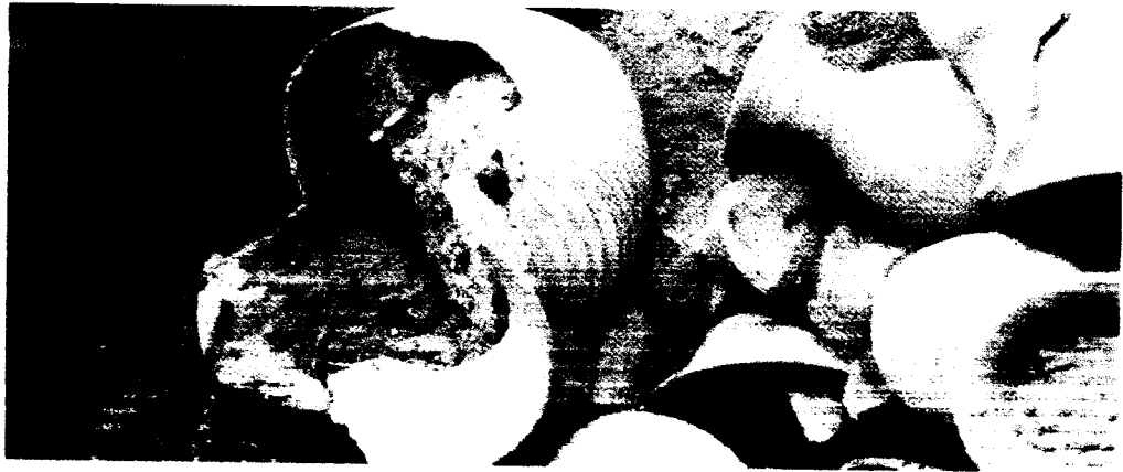
ภาพที่ ๑ ภาชนะดินเผาที่บรรจุลง เป็น เครื่องเซ่นในหลุมศพ

ก. ลักษณะของการฝังศพ และภาชนะดินเผาที่บรรจุลง เป็น เครื่องเซ่นในหลุมศพ