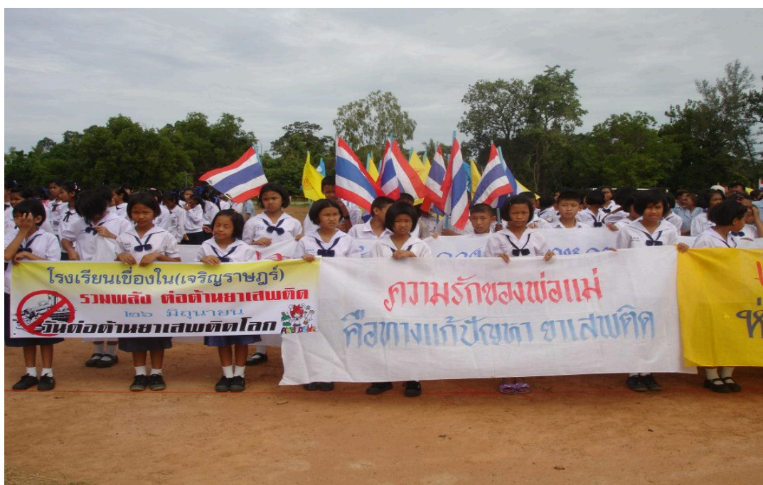
ภาพ ๑.๒ ร่วมกิจกรรมรวมพลังต่อต้านยาเสพติดในวันต่อต้านยาเสพติดโลก