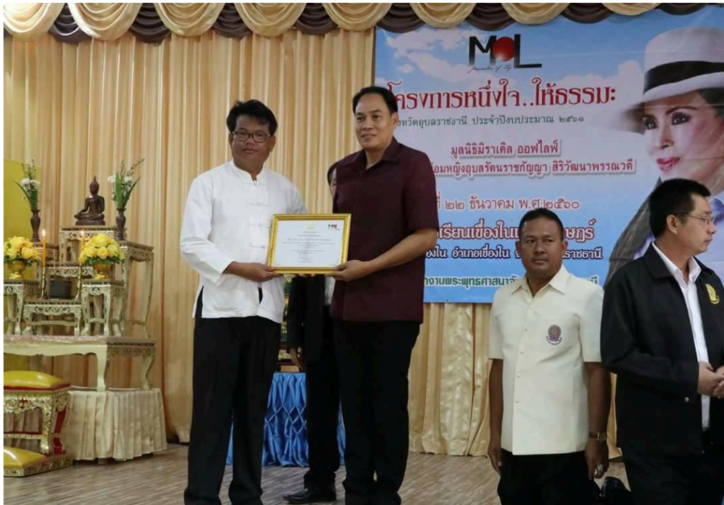
ภาพ ๑.๙ รางวัลโรงเรียนคุณธรรมวิถีพุทธดีเด่น