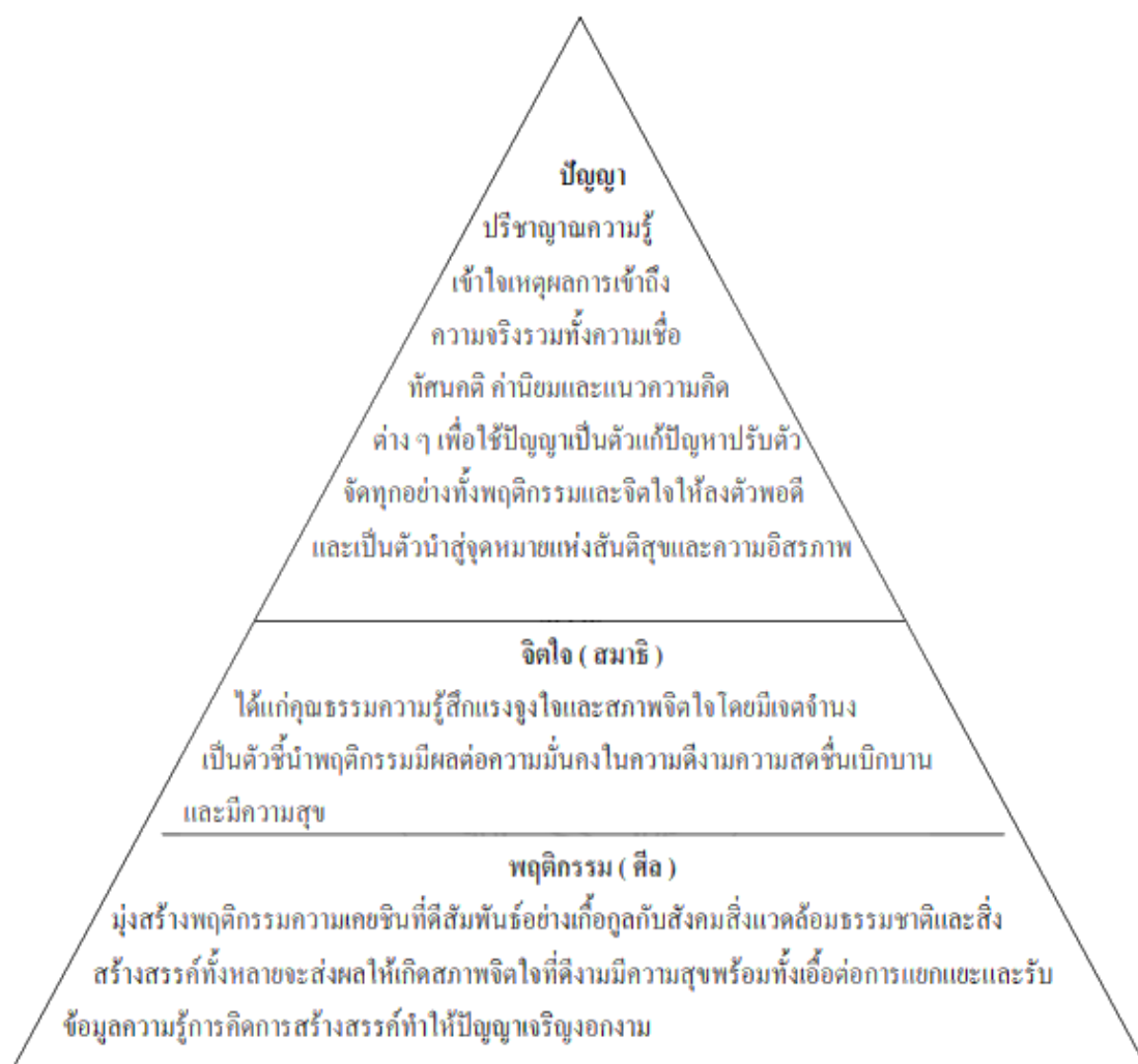
ภาพที่ ๒.๑ การพัฒนาผู้เรียนตามหลักไตรสิกขา

กระทรวงศึกษาธิการ ๑๓ กำหนดหลักธรรมสำคัญสู่การดำเนินงานโรงเรียนวิถีพุทธ ๔ ประการ ดังนี้