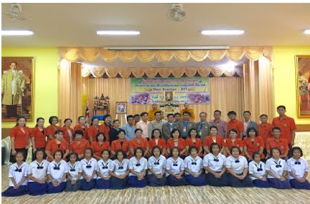
ภาพ ๑.๔ กิจกรรมกลุ่มเยาวชนจิตอาสา