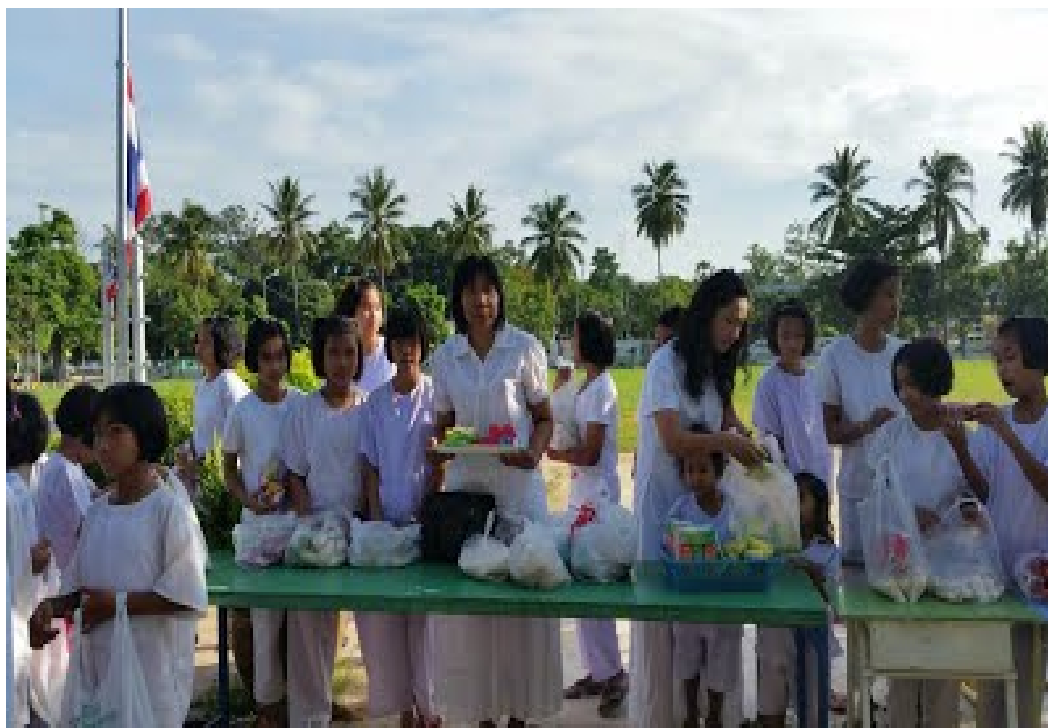
ภาพ ๑.๘ กิจกรรมตักบาตรวันสำคัญทางพระพุทธศาสนา