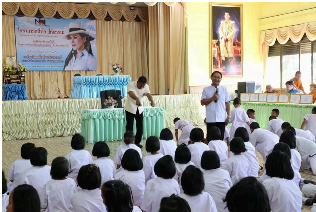
ภาพ ๑.๕ กิจกรรมโครงการหนึ่งใจให้ธรรมะ