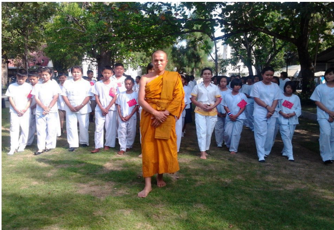
ภาพ ๑.๑ โครงการต้นกล้าคุณธรรม ณ วัดเขื่องกลาง อ.เขื่องใน จ.อุบลราชธานี