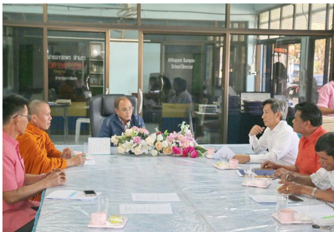
ภาพ ๑.๖ ประชุมคณะกรรมการสถานศึกษาการดำเนินงานโรงเรียนวิถิพุทธ