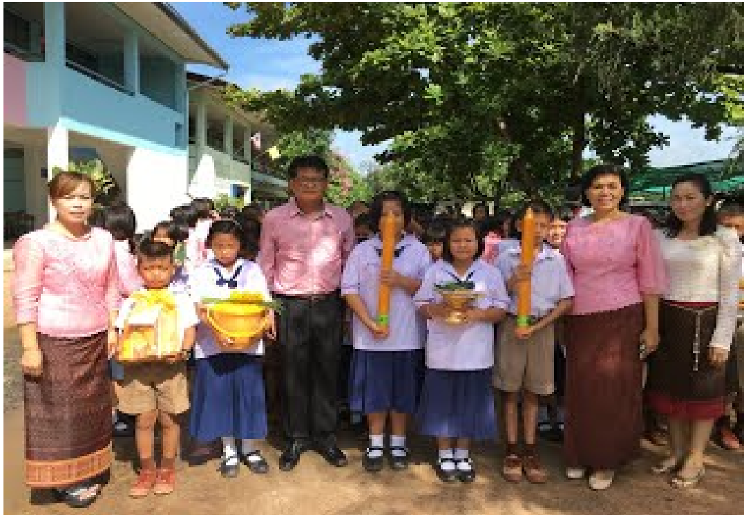
ภาพ ๑.๓ กิจกรรมถวายเทียนวันเข้าพรรษา ณ วัดเขื่องกลาง อ.เขื่องใน จ.อุบลราชธานี