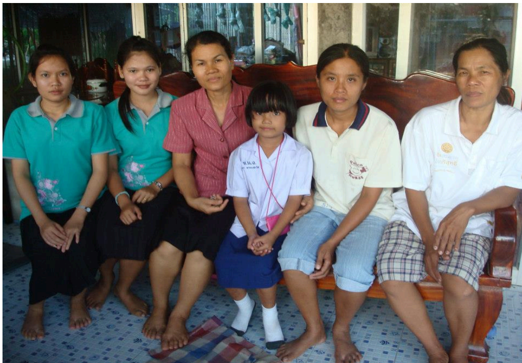
ภาพ ๑.๗ ติดตามเยี่ยมบ้านนักเรียน